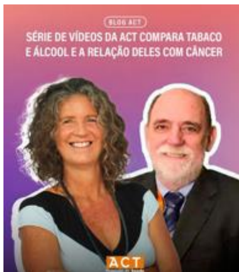
Figura 2 – Vídeo sobre a relação entre as bebidas alcoólicas e câncer.