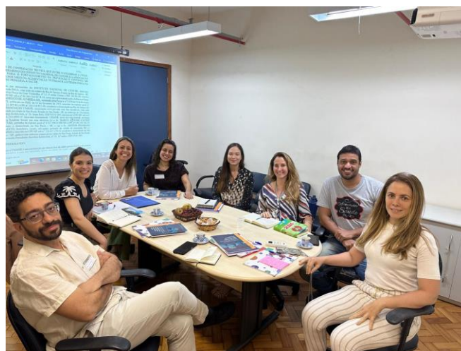
Figura 3 – Reunião da ATANAFc com a UMANE e a ABRASCO.

Em junho a ATANAFc realizou reunião com a UMANE e com a associação Brasileira de Saúde Coletiva (ABRASCO) para tratar de possíveis parcerias em projetos para prevenção de câncer por meio da alimentação, nutrição e atividade física.