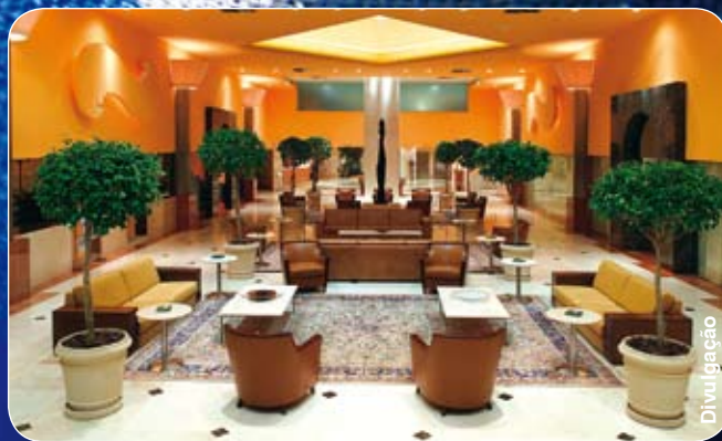
Windsor Barra: Durante três dias, sede do encontro internacional.

Mas o que isso representa na prática? Ao retornar aos países de origem, os participantes terão um conhecimento maior de como problemas similares têm sido abordados em outros países, subsídios que facilitarão a implementação de estratégias mais eficientes a sua realidade. Estão previstas ainda sessões de planejamento efetivo de ações para que as autoridades presentes saiam do congresso, ao menos, com um esboço de estratégia ou ação bem adiantado.