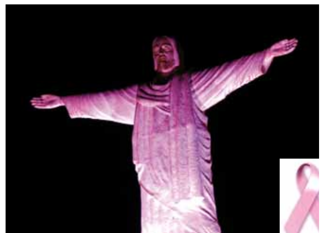
Figura 4. Cristo Redentor iluminado de rosa e laço rosa, símbolo do Outubro Rosa

de mama. O nome remete à cor do laço rosa que simboliza, mundialmente, a luta contra o câncer de mama e estimula a participação da sociedade.