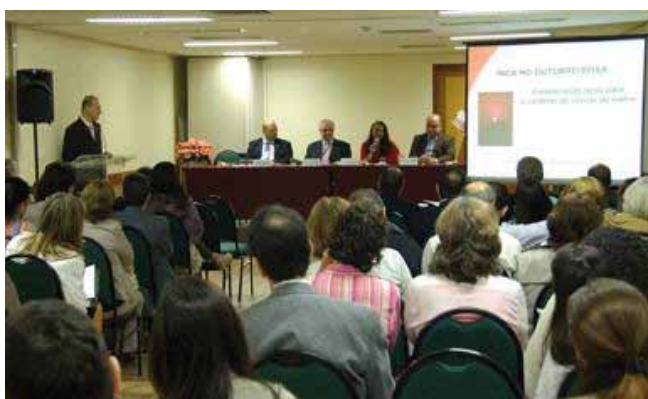
Figura 5. Mesa de abertura do evento “INCA no Outubro Rosa: fortalecendo laços para o controle do câncer de mama”. Rio de Janeiro, 31 de outubro de 2011

Durante o evento, o INCA lançou sete recomendações para redução da mortalidade por câncer de mama. As recomendações abordam especificamente o tratamento e complementam as lançadas em 2010. O propósito do conjunto das recomendações é apontar a situação desejada da política de controle do câncer de mama, com vistas a orientar os esforços dos diferentes atores e provocar a sinergia das ações.