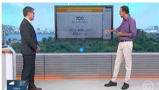
Fevereiro RJTV: leitos bloqueados