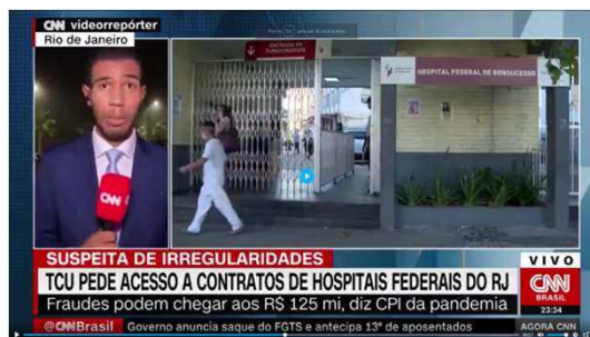
Março CNN: relatório TCU contratos federais no RJ