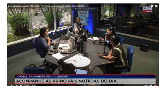
Setembro BandNews: falta de médicos na emergência do HC I