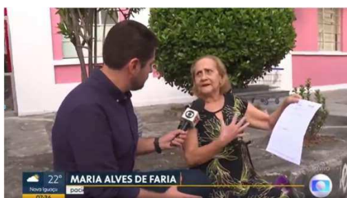
Junho TV Globo: laudos HC III