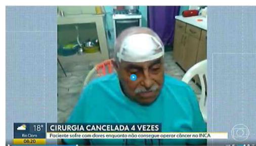
Julho TV Globo: cirurgia cancelada